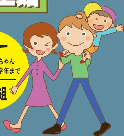
協力:パパスマイル四日市